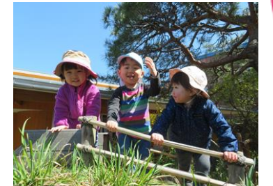
滑り台から：「こっちだよ」