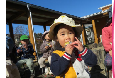
焼きいも会「甘いね☆」