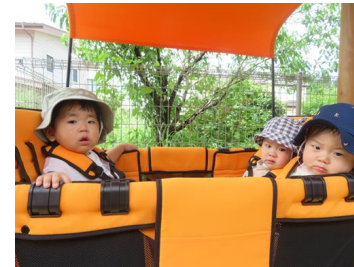
散歩：「バギーに乗って出発」