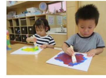
絵の具遊び：「きれいな色」