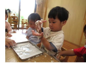
片栗粉あそび：「とろとろ！」