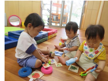
友だちと：「何して遊ぶ？」